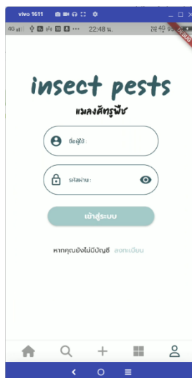
ภาพประกอบที่ ข-2 หน้าเข้าสู่ระบบ