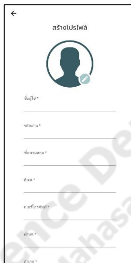
ภาพประกอบที่ ข-1 หน้าลงทะเบียน

หน้าลงทะเบียนสามารถสมัครเป็นลงทะเบียนได้ โดยกดปุ่ม บันทึก และกรอกข้อมูลส่วนตัวของผู้ใช้งาน โดยจะมีช่องให้กรอกชื่อผู้ใช้ รหัสผ่าน ชื่อนามสกุล อีเมล เบอร์โทรศัพท์ ตำบล อำเภอ จังหวัด สถานะผู้ใช้ เมื่อกรอกข้อมูลครบแล้วนั้นให้กดปุ่ม บันทึก เป็นการบันทึกข้อมูล