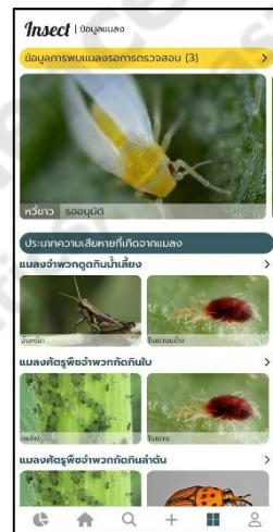
ภาพประกอบที่ ข-5 หน้าข้อมูลการพบแมลงแพร่ระบาด