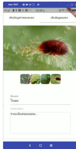
ภาพประกอบที่ ข-4 หน้าเพิ่มข้อมูลแมลงศัตรูพืช