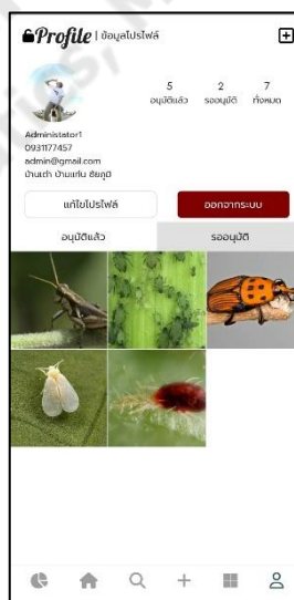
ภาพประกอบที่ ข-7 หน้าข้อมูลส่วนตัว

หน้าข้อมูลส่วนตัว ผู้ใช้สามารถแก้ไขข้อมูลโปรไฟล์ของตัวเองได้ โดยกดที่ปุ่ม แก้ไขโปรไฟล์ เมื่อแก้ไขข้อมูลเสร็จสิ้นให้กดปุ่ม บันทึก เพื่อบันทึกข้อมูลที่ทำกรแก้ไขและยังสามารถแก้ไขข้อมูลแมลงศัตรูพืชและข้อมูลการพบแมลงแพร่ระบาดที่ผู้ใช้เป็นผู้เพิ่มเข้ามา โดยกดที่รูปภาพของแมลงที่ต้องการแก้ไข จากนั้นแก้ไขข้อมูลเมื่อทำการแก้ไขเสร็จกดปุ่ม บันทึก เป็นบันทึกข้อมูลที่ทำกรแก้ไข