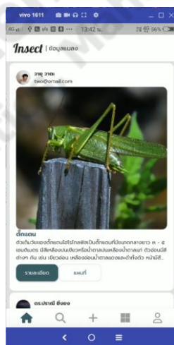
ภาพประกอบที่ ข-3 หน้าหลัก

หน้าหลักแสดงข้อมูลแมลงศัตรูพืช เมื่อผู้ใช้เข้าสู่ระบบสำเร็จ ระบบจะนำผู้ใช้อย่างหน้าหลักของแอปพลิเคชันที่มีข้อมูลของแมลงศัตรูพืช วิธีป้องกันและกำจัด และตำแหน่งที่พบ