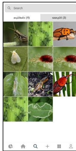
ภาพประกอบที่ ข-6 หน้าค้นหาข้อมูลแมลง