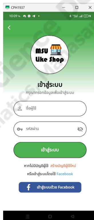
ภาพประกอบที่ 4.1 หน้าเข้าสู่ระบบ