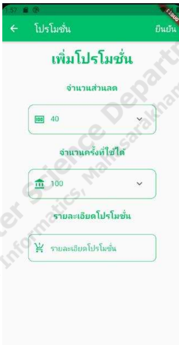
ภาพประกอบที่ 4.17 การเพิ่มโปรโมชั่น

เป็นฟังก์ชันในส่วนของแอดมินที่จะทำการเพิ่มโปรโมชั่นของสินค้าในแอปพลิเคชันซึ่งสามารถใช้ได้กับสินค้าในแอปพลิเคชันได้ทั้งหมดโดยแอดมินจะสามารถกำหนดส่วนลด จำนวนครั้งที่ใช้ได้ และรายละเอียดโปรโมชั่นได้ซึ่งโปรโมชั่นจะสามารถถูกเปิดปิดสถานะการใช้งานได้ ดังภาพประกอบที่ 4.17