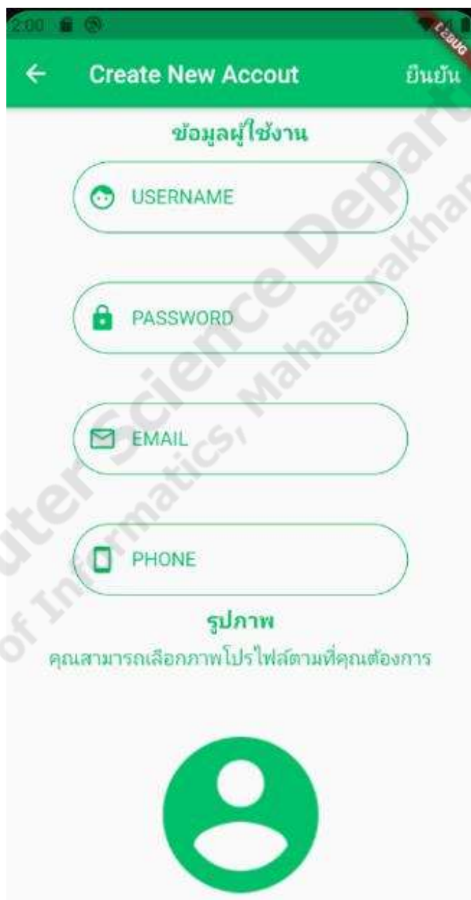
ภาพประกอบที่ 4.2 การสมัครสมาชิก

เป็นฟังก์ชันในส่วนของผู้ใช้ทั่วไปที่จะทำการกรอกข้อมูล ชื่อผู้ใช้ รหัสผ่าน อีเมล เบอร์โทรศัพท์ รูปภาพโปรไฟล์ เพื่อทำการสมัครสมาชิกเพื่อใช้งานแอปพลิเคชัน ดังภาพประกอบ 4.2