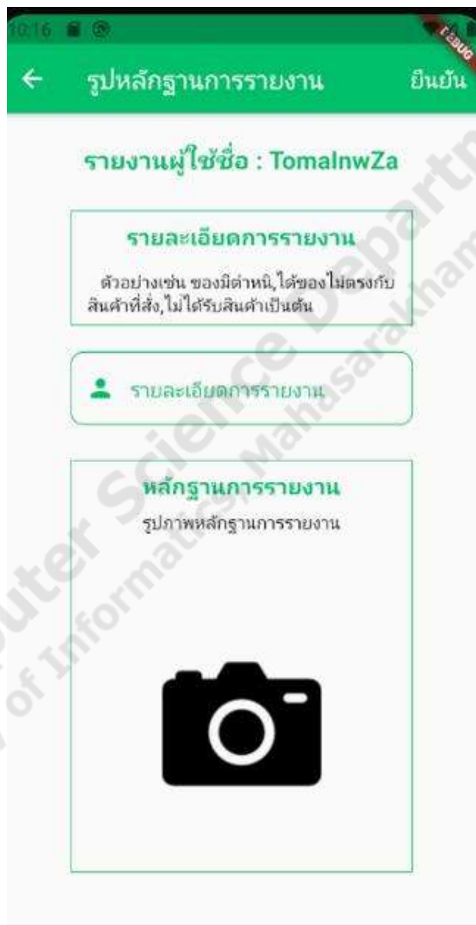
ภาพประกอบที่ 4.16 ฟังก์ชันการรายงานผู้ใช้

เป็นฟังก์ชันในส่วนของผู้ใช้ที่เป็นสมาชิกที่จะทำการรายงานข้อมูลผู้ใช้ให้กับแอดมินในกรณีที่สมาชิกที่เป็นผู้ขายมีการส่งสินค้าหลังจากที่ชำระเงินและคำสั่งซื้ออนุมัติไปแล้ว ดังภาพประกอบที่ 4.16