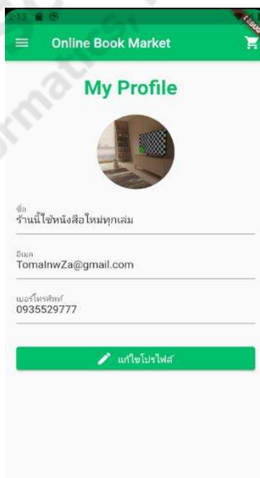
ภาพประกอบที่ 4.3 การเพิ่มข้อมูลที่อยู่

เป็นฟังก์ชันในส่วนของผู้ใช้ที่เป็นสมาชิกที่จะทำการแก้ไขข้อมูลผู้ใช้โดยการ แก้ไขข้อมูลชื่อผู้ใช้ รหัสผ่าน อีเมล เบอร์โทรศัพท์ รูปภาพโปรไฟล์ ดังภาพประกอบ 4.3