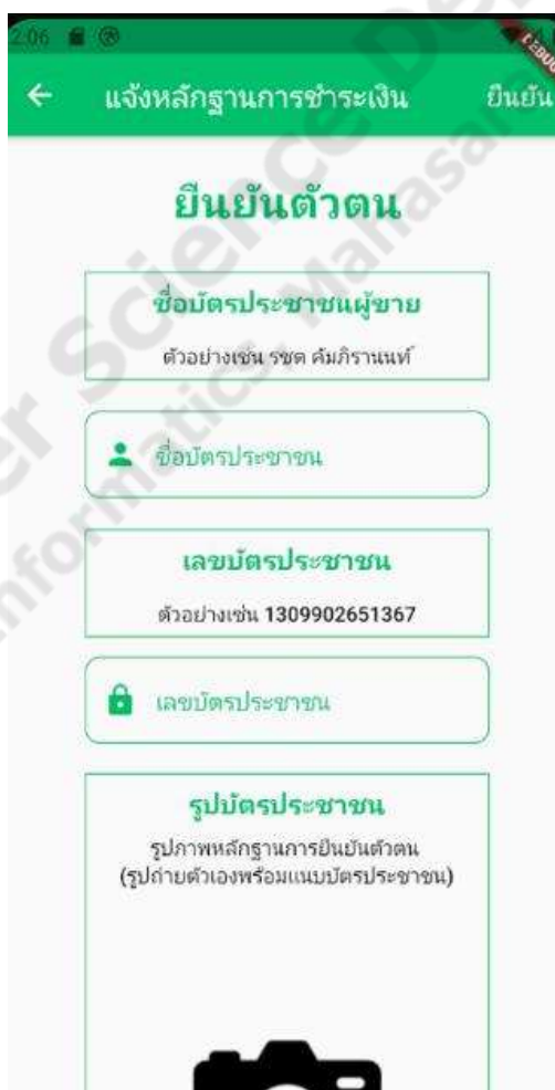
ภาพประกอบที่ 4.7 การยืนยันตัวตนเพื่อเป็นผู้ขาย

เป็นฟังก์ชันในส่วนของผู้ใช้ที่เป็นสมาชิกที่จะทำการยืนยันตัวตนเพื่อที่จะสามารถทำการขายสินค้าได้ซึ่งจะประกอบด้วย ชื่อจริง, เลขบัตรประชาชน, รูปถ่ายคู่กับบัตรประชาชน ดังภาพประกอบ 4.7 โดยหลังจากที่ทำการยืนยันตัวตนไปแล้วแอดมินจะเป็นผู้ตัดสินว่าการยืนยันตัวตนนั้นผ่านหรือเปล่าซึ่งผู้ที่ยืนยันตัวตนไปแล้วจะไม่สามารถยืนยันตัวตนได้อีก