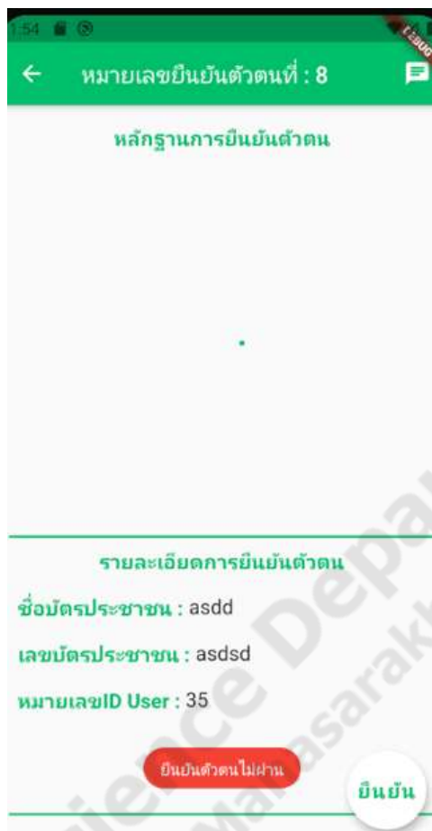
ภาพประกอบที่ 4.19 การตรวจสอบการยืนยันตัวตน