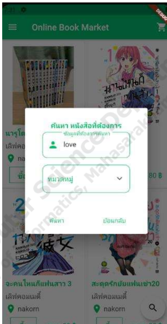
ภาพประกอบที่ 4.11 การค้นหาสินค้า

เป็นฟังก์ชันในส่วนของผู้ใช้ที่เป็นสมาชิกที่จะค้นหาหนังสือที่ต้องการจากชื่อหนังสือหรือค้นหาจากหมวดหมู่ของหนังสือนั้น ดังภาพประกอบที่ 4.11