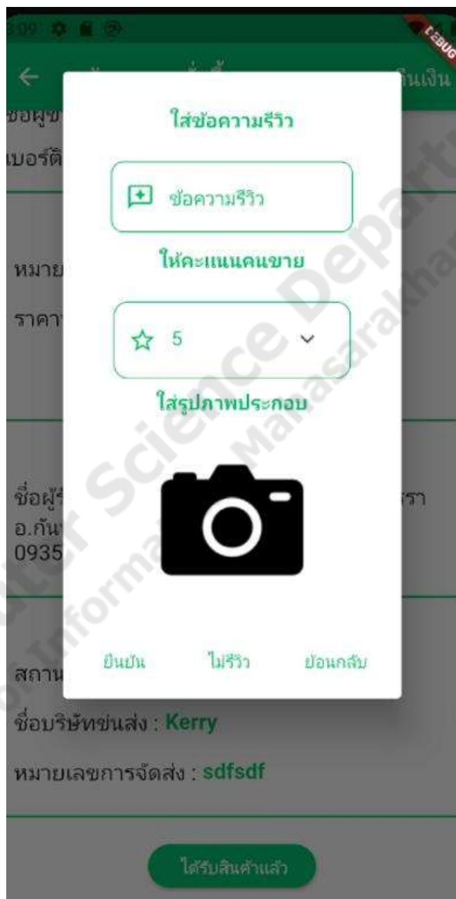
ภาพประกอบที่ 4.13 การรีวิว

เป็นฟังก์ชันในส่วนของผู้ใช้ที่เป็นสมาชิกที่จะใช้ในการรีวิวสินค้าหลังจากที่ซื้อสินค้าโดยผู้ซื้อสามารถที่จะเลือกรีวิวสินค้าของผู้ขายหรือไม่รีวิวก็ได้ ดังภาพประกอบที่ 4.13