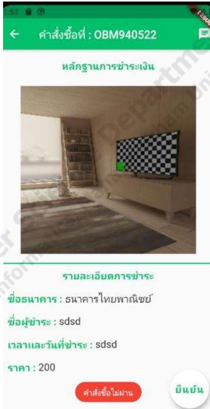
ภาพประกอบที่ 4.18 การตรวจสอบการสั่งซื้อ

เป็นฟังก์ชันในส่วนของแอดมินที่จะทำการตรวจสอบคำสั่งซื้อหลังจากที่ผู้ซื้อได้ซื้อสินค้าไปแล้วแอดมินจะทำการตรวจสอบความถูกต้องของคำสั่งซื้อนั้นก่อนที่จะอนุมัติการสั่งซื้อ ดังภาพประกอบที่ 4.18