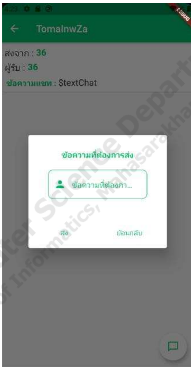
ภาพประกอบที่ 4.12 การติดต่อ

เป็นฟังก์ชันในส่วนของผู้ใช้ที่เป็นสมาชิกที่จะใช้ในการส่งข้อความเพื่อคุยกันระหว่างผู้ซื้อและผู้ขาย ดังภาพประกอบที่ 4.12