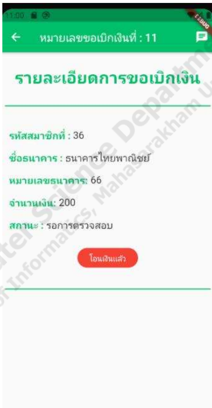
ภาพประกอบที่ 4.21 การตรวจสอบการขอเบิกเงิน

เป็นฟังก์ชันในส่วนของแอดมินที่จะทำการตรวจสอบ การขอเบิกเงินของผู้ชายโดยแอดมินจะทำการตรวจสอบความถูกต้องของข้อมูลการขอเบิกเงินก่อนที่จะอนุมัติการขอเบิกเงินของผู้ชาย ดังภาพประกอบที่ 4.21