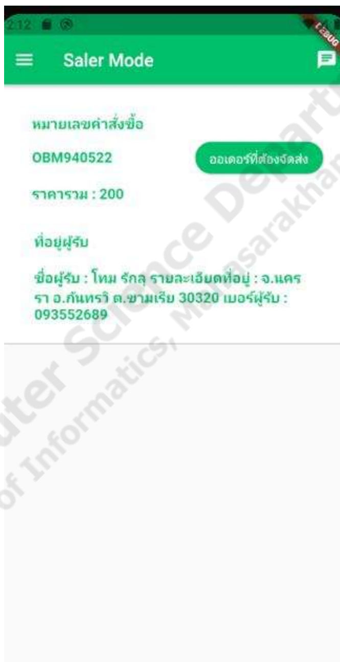
ภาพประกอบที่ 4.10 การจัดส่งสินค้า

เป็นฟังก์ชันในส่วนของผู้ใช้ที่เป็นสมาชิกที่ในโหมดผู้ขายที่จะทำการส่งสินค้าหลังจากที่แอดมินอนุมัติคำสั่งซื้อของออเดอร์นั้นผู้ขายจะทำการจัดส่งสินค้าตามออเดอร์ที่สั่งและทำการแจ้งหมายเลขการจัดส่งให้กับลูกค้าและแพลตฟอร์มที่จัดส่งหรือทำการยกเลิกออเดอร์หากไม่มีสินค้า ดังภาพประกอบ 4.10