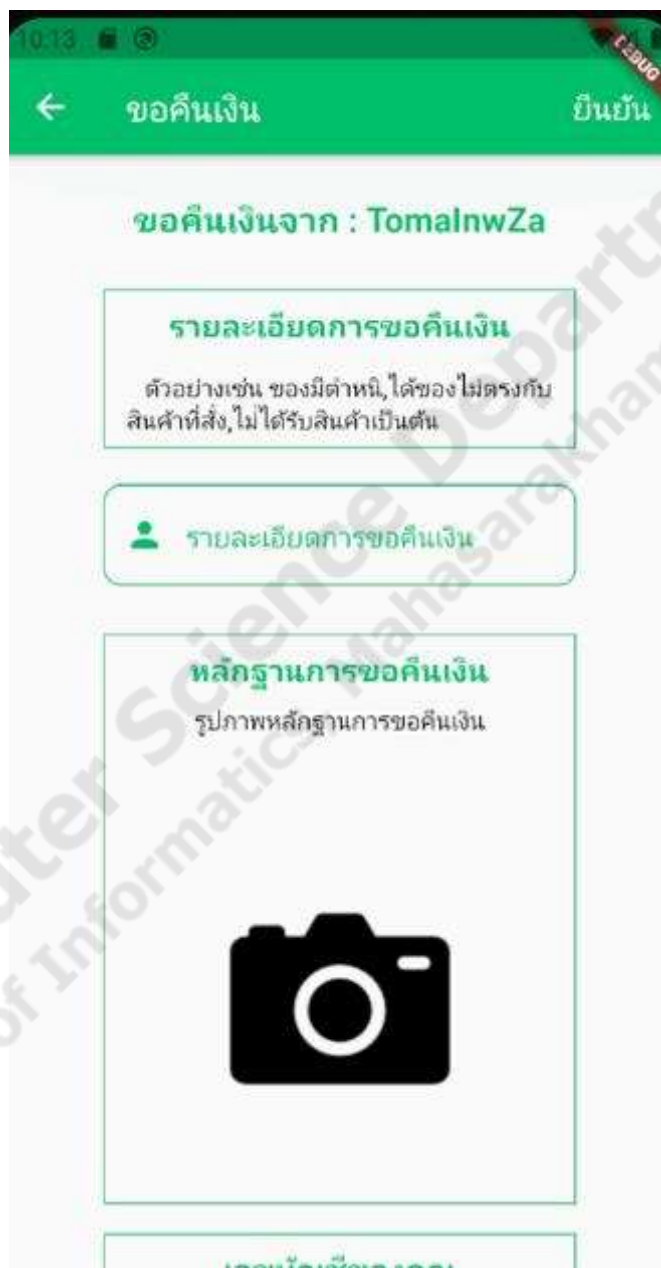
ภาพประกอบที่ 4.14 ฟังก์ชันการขอเงินคืน

เป็นฟังก์ชันในส่วนของผู้ใช้ที่เป็นสมาชิกที่ เป็นผู้ซื้อที่ใช้ในการขอเงินคืนในกรณีที่สั่งซื้อสินค้าไปแล้วทางร้านค้าไม่มีสินค้าหรือทางร้านค้าไม่ส่งสินค้าโดยทางแอดมินจะเป็นผู้ที่ทำการโอนเงินให้กับลูกค้าหลังจากที่ตรวจสอบแล้ว ดังภาพประกอบที่ 4.14