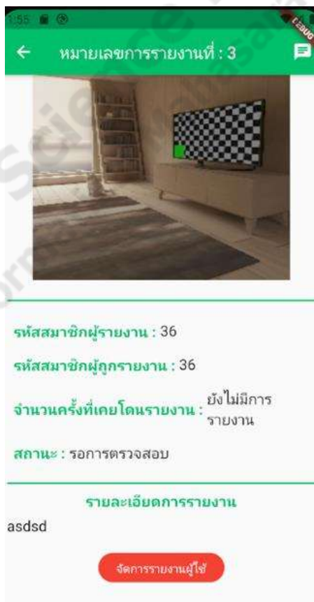
ภาพประกอบที่ 4.22 การจัดการผู้ใช้

เป็นฟังก์ชันในส่วนของแอดมินที่จะทำการจัดการกับผู้ใช้ที่ถูกรายงานซึ่งจะมีทั้งการแบนการใช้งานและการตัดเดือนโดยขึ้นอยู่กับดุลยพินิจของแอดมิน ดังภาพประกอบที่ 4.22