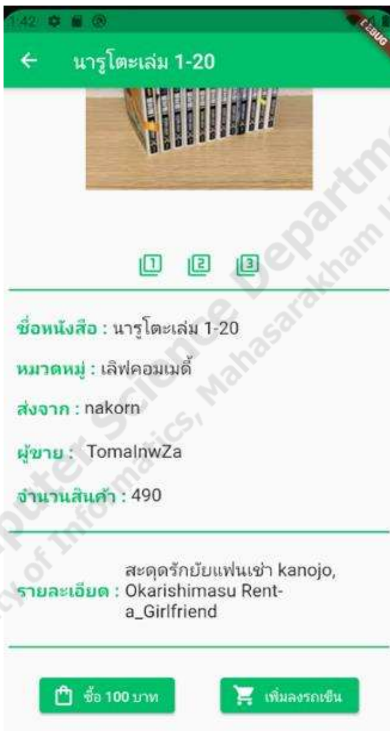
ภาพประกอบที่ 4.5 การซื้อสินค้า

เป็นฟังก์ชันในส่วนของผู้ใช้ที่เป็นสมาชิกที่จะทำการซื้อสินค้า ดังภาพประกอบ 4.5