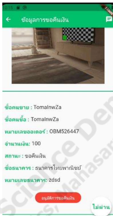
ภาพประกอบที่ 4.20 การตรวจสอบการขอคืนเงิน

เป็นฟังก์ชันในส่วนของแอดมินที่จะทำการตรวจสอบคำสั่งซื้อการขอเงินคืนของผู้ซื้อแอดมินจะทำการตรวจสอบความถูกต้องของข้อมูลการขอเงินคืนก่อนที่จะอนุมัติการขอเงินคืนของผู้ซื้อ ดังภาพประกอบที่ 4.20