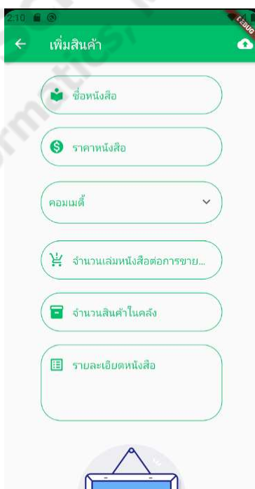
ภาพประกอบที่ 4.8 การเพิ่มสินค้า

เป็นฟังก์ชันในส่วนของผู้ใช้ที่เป็นสมาชิกที่ในโหมดผู้ขายที่จะทำการเพิ่มข้อมูลหนังสือที่ต้องการจะขายซึ่งประกอบด้วย ชื่อหนังสือ ราคาหนังสือ หมวดหมู่หนังสือ จำนวนเล่มหนังสือต่อการขาย จำนวนสินค้าในคลังและรูปหนังสือ ดังภาพประกอบ 4.8