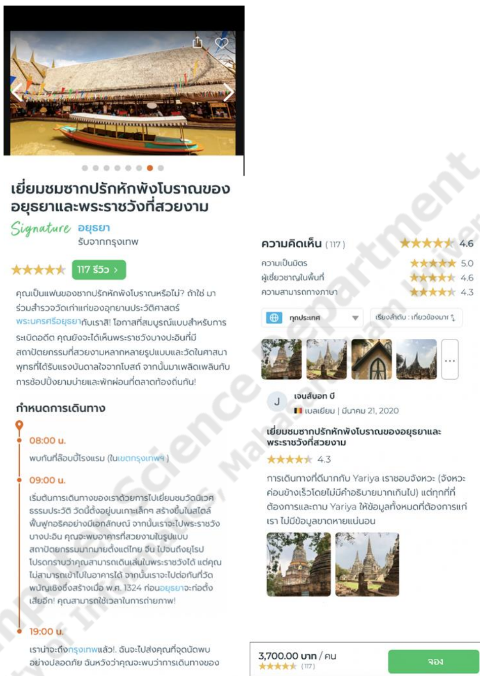
ภาพประกอบที่ 1.8 หน้าแสดงรายละเอียดสถานที่ท่องเที่ยว

ผู้ใช้ระบบที่เป็นสมาชิกแล้ว จะสามารถเลือกดูสถานที่ท่องเที่ยวได้อย่างหลากหลาย พร้อม แสดงรายละเอียดและราคาของทริป ดังภาพประกอบที่ 1.8