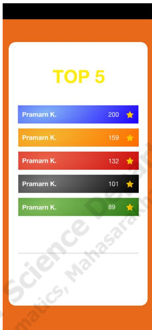
ภาพประกอบที่ 1.3 ชาร์ตคะแนนความนิยมโค้ด

ผู้ใช้ระบบสามารถดูชาร์ตคะแนนความนิยม ของโค้ดดีเด่น 5 อันดับแรกรายสัปดาห์ของระบบ ได้ ดังภาพประกอบที่ 1.3