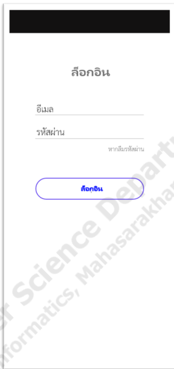
ภาพประกอบที่ 1.6 หน้าเข้าสู่ระบบ

ผู้ใช้ระบบที่เคยสมัครสมาชิกไว้แล้ว สามารถล็อกอินเข้าระบบได้เลย โดยกรอกข้อมูลอีเมลและรหัสผ่าน ดังภาพประกอบที่ 1.6