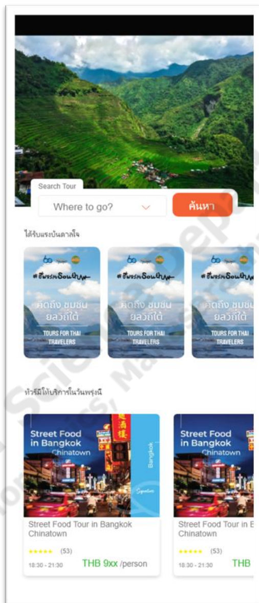
ภาพประกอบที่ 1.2 หน้าหลักแอปพลิเคชัน

ผู้ใช้งานสามารถเข้าดูหน้าแอปพลิเคชันได้ สามารถค้นหาได้ และยังสามารถเลื่อนดูสถานที่ท่องเที่ยวได้อย่างหลากหลาย ดังภาพประกอบที่ 1.2