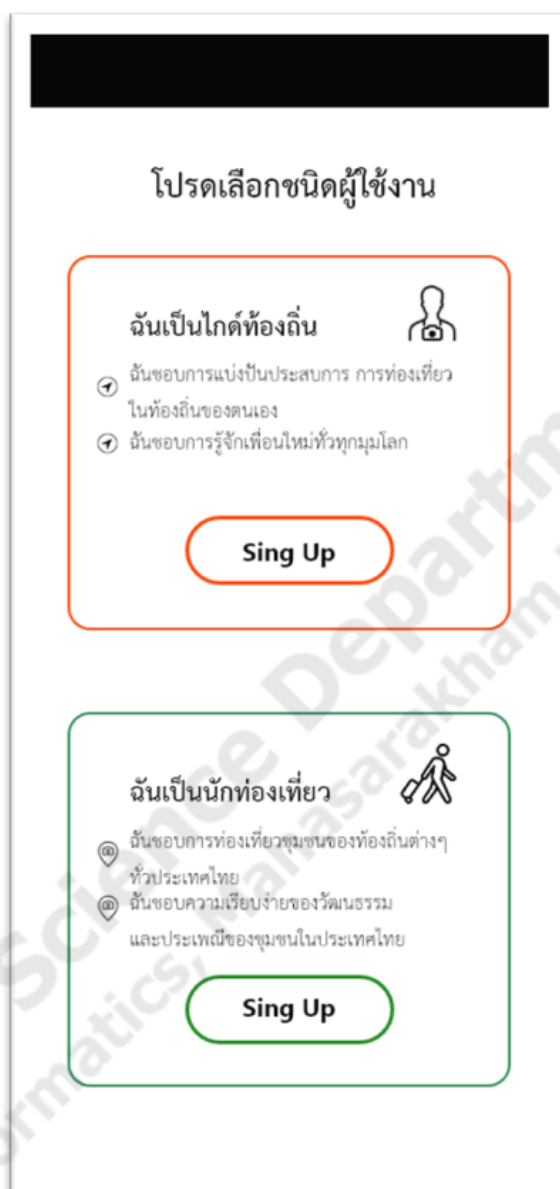
ภาพประกอบที่ 1.4 หน้าเลือกประเภทสมัครสมาชิก

ผู้ใช้งานทั่วไป สามารถเลือกที่จะสมัครสมาชิกเพื่อเป็นนักท่องเที่ยว หรือสมัครเป็นไกด์ได้ ดังภาพประกอบที่ 1.4