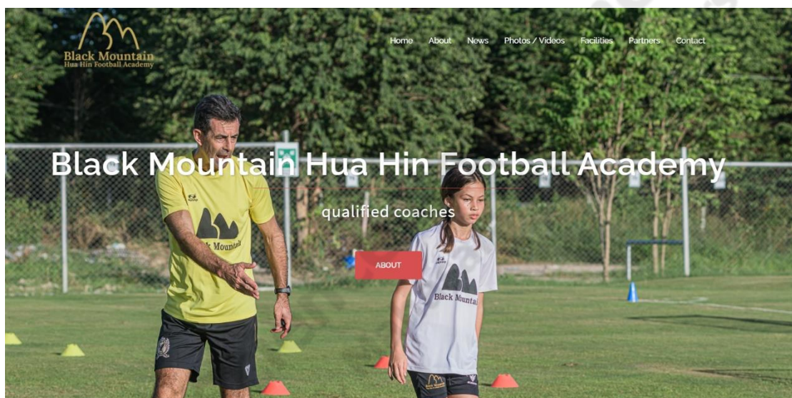
ภาพประกอบที่ 2.2

แบล็คเมาท์เทนหัวหินฟุตบอลอคาเดมี่ตั้งอยู่ในรีสอร์ทแบล็คเมาท์เทนอันทรนเกียรติซึ่งมีสนามกอล์ฟและสวนน้ำที่ได้รับรางวัล การฝึกอบรมจะเกิดขึ้นในสนามหญ้าใหม่ที่โรงเรียนนานาชาติหัวหิน หัวหน้าโค้ชเป็นอดีตทีมที่ออตแนมและกองหลังแกรีส์ตีเวนส์ เขาเป็นโค้ชที่ได้รับใบอนุญาต UEFA Pro ที่จัดการแข่งขันในระดับสูงสุดในหลายประเทศและได้รับรางวัลยูฟ่าคัพในฐานะผู้เล่น สถาบันการศึกษาเปิดสำหรับเด็กชายและเด็กหญิงอายุ 4 ปีขึ้นไป