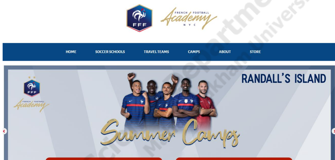
ภาพประกอบที่ 2.3

เป็นอคาเดมี่ฟุตบอลฝรั่งเศส สามารถต้อนรับนักเรียนหลายร้อยคนโดยไม่คำนึงถึงสัญชาติ อคาเดมี่พยายามที่จะรับสมัครผู้เล่นอายุน้อยที่มีแรงบันดาลใจในนิวยอร์กซึ่งกำลังมองหาที่จะก้าวต่อไปในอาชีพนักฟุตบอล อคาเดมี่ให้เส้นทางการศึกษาที่สมบูรณ์แก่นักศึกษาเต็มเวลาโดยมุ่งเน้นที่การพัฒนาด้านกีฬา การศึกษาเชิงวิชาการ และการฝึกอบรมที่ได้รับการสนับสนุนจากความเป็นเลิศทางเทคนิคระดับโลก