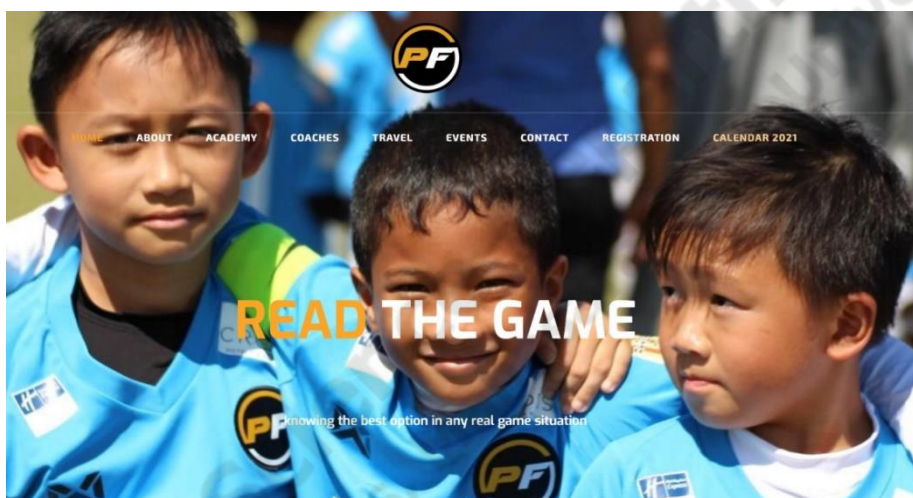
ภาพประกอบที่ 2.1 www.pfabangkok.com

PFA เป็นสถาบันฟุตบอลที่ก่อตั้งขึ้นในกรุงเทพฯ ในปี 2016 โดยกลุ่มผู้เชี่ยวชาญจากบาร์เซโลนา (สเปน) ที่มีประสบการณ์อันยาวนานและได้รับการยอมรับในโลกรของการสอนกีฬาในระดับสากล จุดแข็งหลักของ PFA คือการมีเจ้าหน้าที่ด้านเทคนิคที่มีคุณสมบัติสูงที่มีประสบการณ์ระดับนานาชาติ