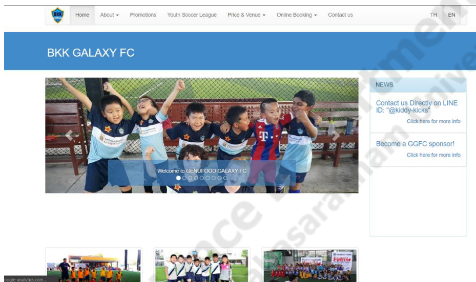
ภาพประกอบที่ 2.5 www.bkkgalaxy.com

BKK GALAXY เป็นสโมสรฟุตบอลแห่งใหม่สำหรับเด็กอายุ 4-19 ปีที่พยายามพัฒนาทั้งผู้เล่นที่มีความสามารถทางเทคนิคและเตรียมพร้อมสำหรับการแข่งขันฟุตบอล BKK GALAXY เชื่อมมั่นในคุณค่าการศึกษาของเกมด้านเล็กและวิธีที่เกมนี้พัฒนาผู้เล่นอายุน้อยที่มีความคิด