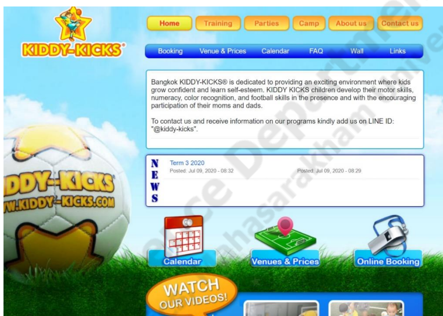
ภาพประกอบที่ 2.6

สโมสรกีฬา Bangkok KIDDY-KICKS มุ่งมั่นที่จะสร้างสภาพแวดล้อมที่น่าตื่นตาตื่นใจสำหรับเด็ก ๆ จะเติบโตอย่างมั่นใจและเรียนรู้การเห็นคุณค่าในตนเองต่อหน้าและด้วยการมีส่วนร่วมที่ให้อำนาจใจของแม่และพ่อของพวกเขาเราเชื่ออย่างยิ่งว่าการได้พบปะกับผู้ปกครองแบบตัวต่อตัวจะทำให้เด็ก ๆ สนุกสนานกับกิจกรรมมากขึ้น และแสดงความพยายามอย่างเต็มที่เพื่อเพิ่มความก้าวหน้าให้สูงสุด