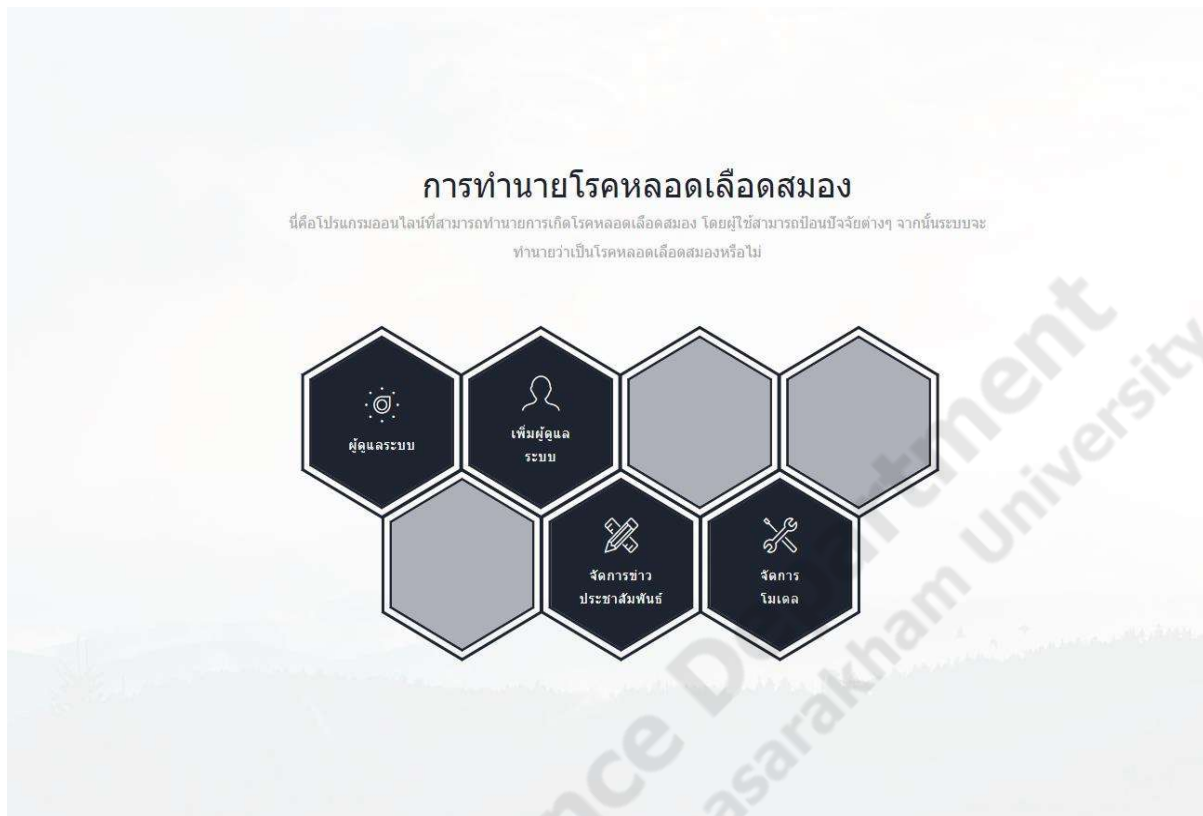
ภาพประกอบที่ ก-4 เมนูหน้าหลัก

เมนูหน้าหลักจะมีปุ่มทางลัดเพื่อเข้าใช้งานดังต่อไปนี้ เมนูจัดการผู้ดูแลระบบ เมนูเพิ่มผู้ดูแลระบบ เมนูจัดการข่าวประชาสัมพันธ์ และเมนูจัดการโมเดล