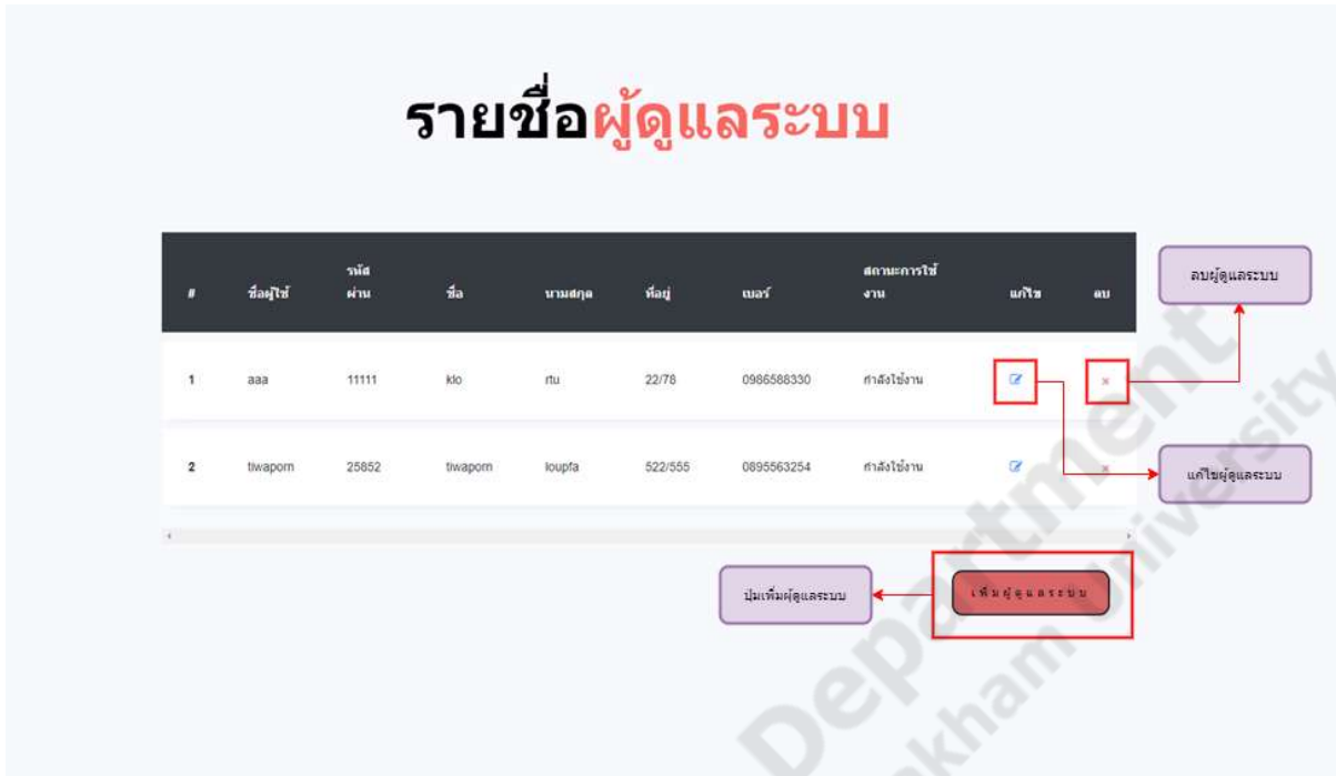
ภาพประกอบที่ ก-5 เมนูผู้ดูแลระบบ

ในหน้าเมนูผู้ดูแลระบบ จะแสดงรายชื่อผู้ดูแลระบบทั้งหมด สามารถลบ และแก้ไขรายชื่อผู้ดูแลระบบได้และในหน้านี้ยังสามารถเพิ่มรายชื่อผู้ดูแลระบบได้ในปุ่มด้านล่าง