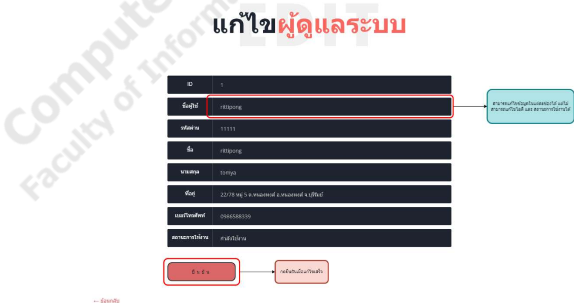
ภาพประกอบที่ ก-6 เมนูแก้ไขผู้ดูแลระบบ