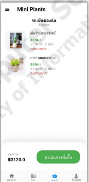
(สั่งซื้อสินค้า)