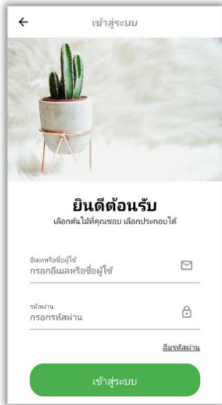
(เข้าสู่ระบบ)

ระบบนี้มีผู้ใช้ 2 กลุ่ม คือ พนักงานหรือเจ้าของร้าน และลูกค้า โดยฟังก์ชันการทำงานที่สำคัญของระบบมี 1. การสมัครสมาชิก 2. การเข้าสู่ระบบโดยแยกระหว่างลูกค้าและพนักงาน 3. การจัดการข้อมูลผู้ใช้ 4. การจัดการข้อมูลร้านค้าและความคิดเห็นต่อร้าน 5. การจัดการข้อมูลสินค้าและโปรโมชั่น 6. การจัดการการสั่งซื้อ จากการทดสอบโดยผู้ทดสอบจำนวน 5 คน โดยทดสอบทั้งหมด 20 ฟังก์ชันการทำงานหลัก พบว่าผ่านการทดสอบทุกฟังก์ชัน ซึ่งผู้ใช้แต่ละกลุ่มได้ให้ข้อเสนอแนะที่สำคัญคือระบบการตอบโต้ระหว่างแอปพลิเคชันกับผู้ใช้ให้มีความสมบูรณ์มากขึ้น