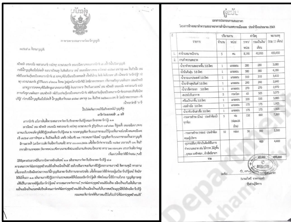
ภาพประกอบที่ 2.2 ภาพตัวอย่างสัญญาจ้าง