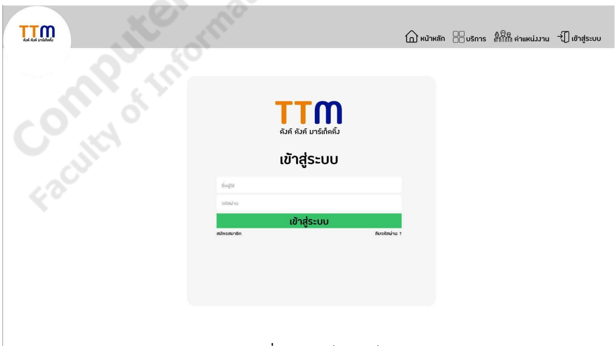
ภาพประกอบที่ 2.6 หน้าล็อกอินเว็บแอปพลิเคชัน