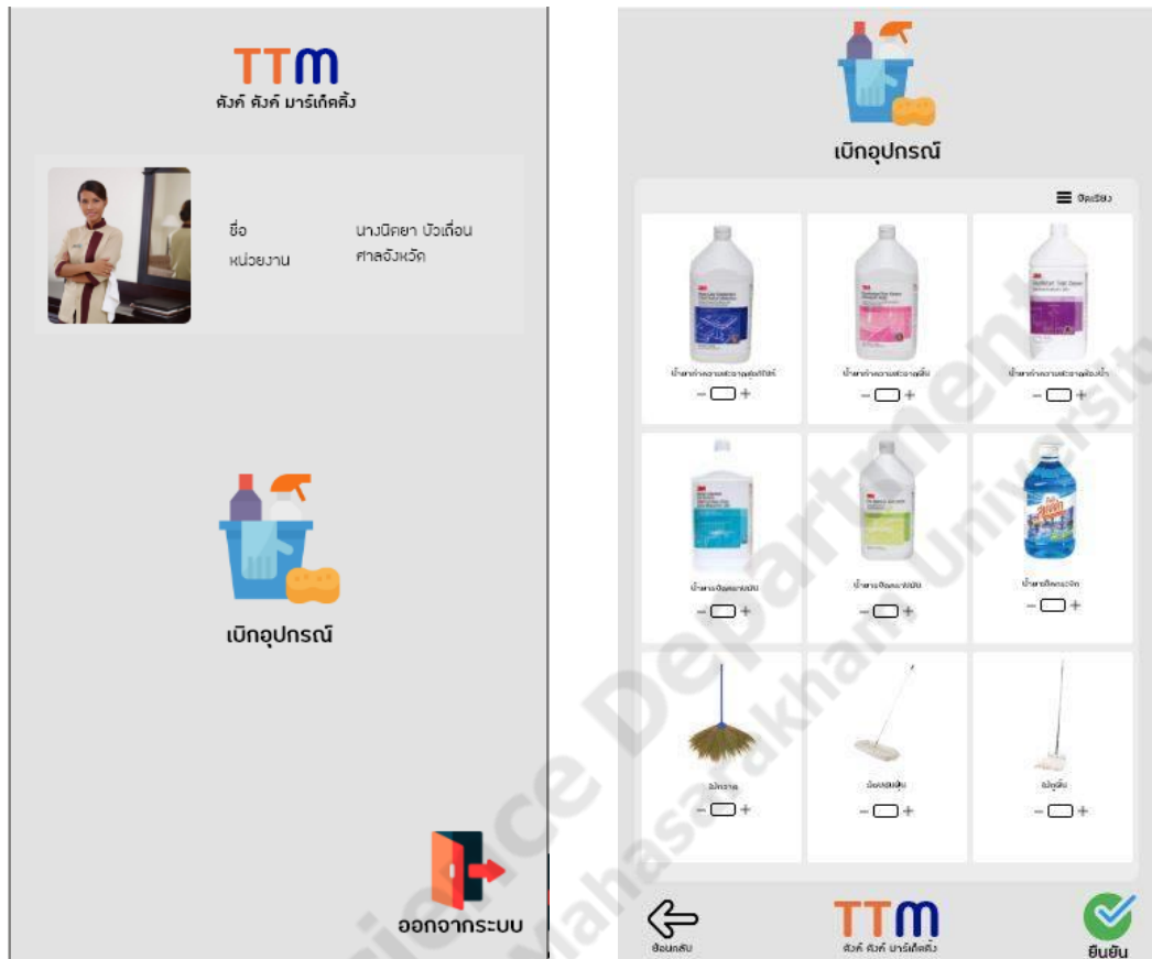
ภาพประกอบที่ 2.7 หน้าเบ็กอุปรณ์ และหน้าฟังก์ชันของพนักงาน