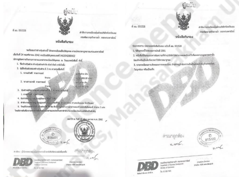
ภาพประกอบที่ 2.1 ภาพตัวอย่างหนังสือรับรองทะเบียนพาณิชย์

ห้างหุ้นส่วนจำกัด ตังค์ ตังค์มาร์เก็ตตั้ง ได้จดทะเบียนพาณิชย์ เมื่อวันที่ 24 พฤษภาคม 2542 เป็นบริษัทรับเหมาทำความสะอาดทั้งภาครัฐและเอกชน