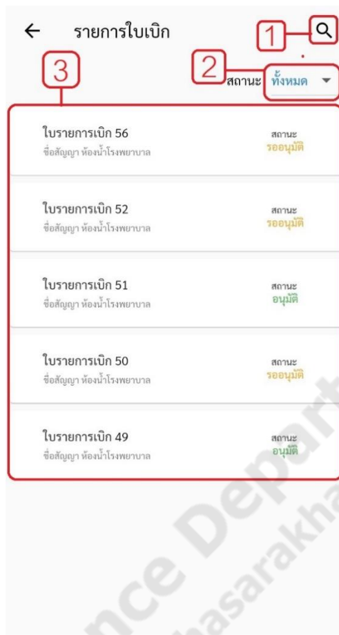
ภาพประกอบที่ ข-2 หน้าใบรายการเบิกอุปกรณ์