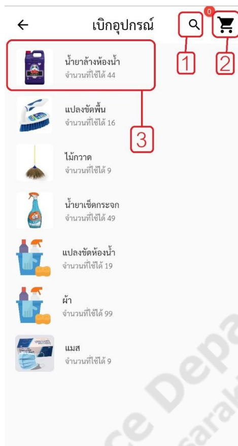
ภาพประกอบที่ ข-3 หน้าการค้นหาอุปกรณ์