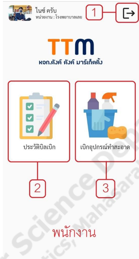
ภาพประกอบที่ ข-1 หน้าหลัก (ฝั่งพนักงาน)